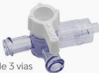
Torneira de 3 vias